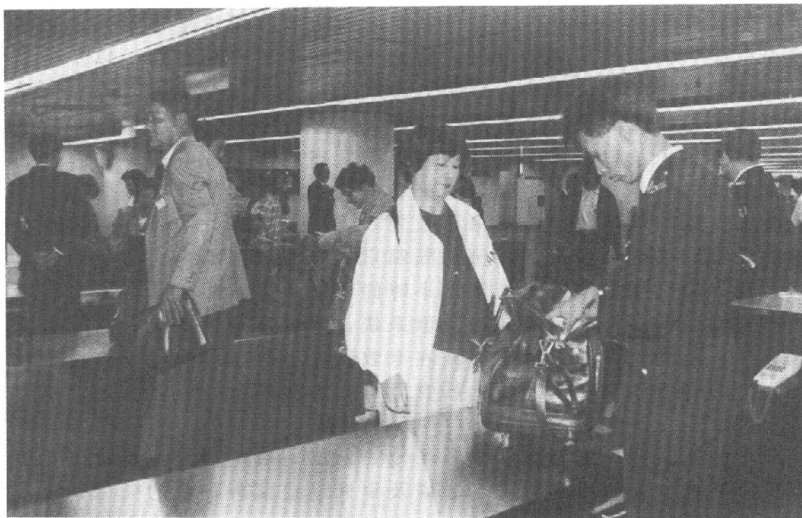
海關人員檢查旅客行李

4.36 政府當局告知我們，他們曾檢討該部門的高層管理架構。根據檢討結果，政府當局提議將負責機場科和邊境及口岸科的兩個主管職位級數，由一般紀律人員薪級表（主任級）第36至38點提高至一般紀律人員薪級表（指揮官級）第1點。政府當局向我們表示，提高職位級數的提議有雙重目的：減輕助理海關總監（行動）的工作，將部分職務授權由其屬下兩科的主管分擔，以及確認兩科主管的職責已經大幅增加。兩科主管的職責有所增加，部分由上述授權引致，但主要原因是近年來兩科主管的工作量已普遍增加。