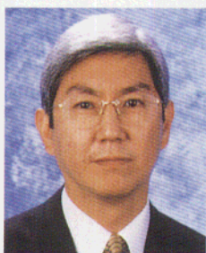
程介南議員 The Hon. Cheng Kai-nam