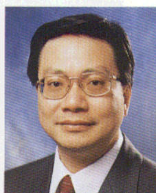
張炳良博士 Dr. Anthony Cheung Bing-leung